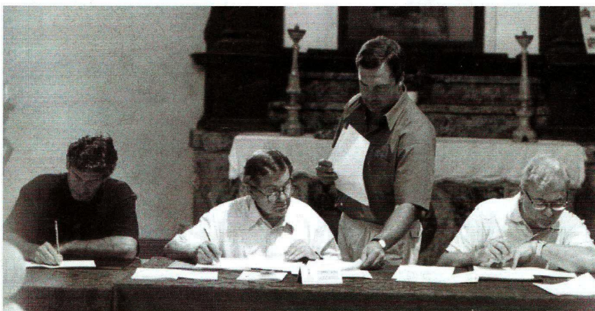
Un momento dei lavori della commissione giudicatrice